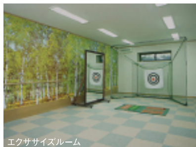
エクササイズルーム

心身の健康に欠かせない運動。しかし、定期的に体を動かすことは簡単なようで、実は難しいものです。時間が取れない、体を動かすための場所や施設がないなどの問題も多々あります。そこで、本邸には地下にエクササイズルームを設け、いつでも軽い運動を可能にしました。体調や天候次第で「外に出るのはちょっと…」とはばかれる場合も気兼ねなく体を動かすことができます。健康作りのスペースが身近にあること…このゆとりが心と体に潤いをもたらせます。